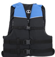
USCG approved & properly fitted life jacket