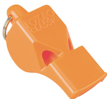
Sound-producing device (one per boat)