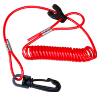
Safety Lanyard attached to operator