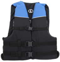
USCG approved & properly fitted life jacket