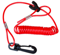
Safety Lanyard attached to operator