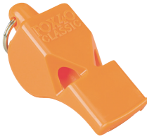
Sound-producing device (one per boat)