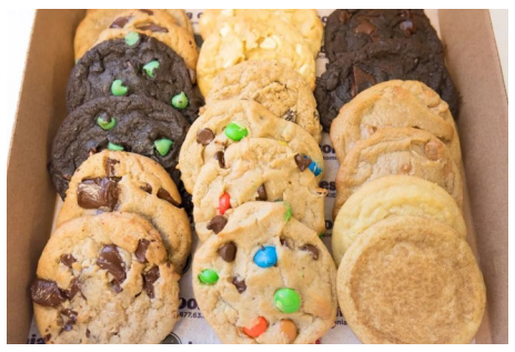
烘焙食品(如饼干、甜甜圈和 水果派)、苹果果脯和康普茶 现在必须满足这些要求