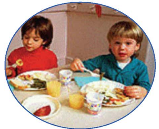
La hora de comer feliz