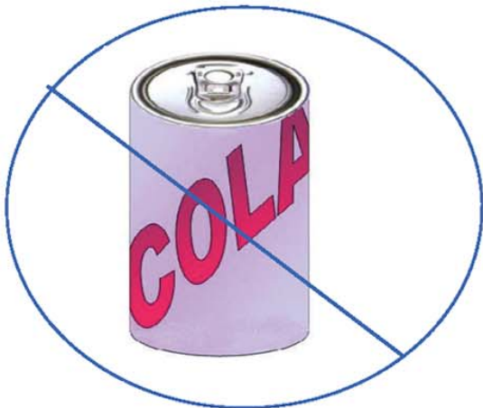
Comidas y bebidas que debe evitar