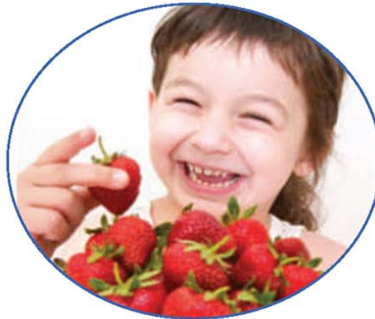
Tamaño de porciones