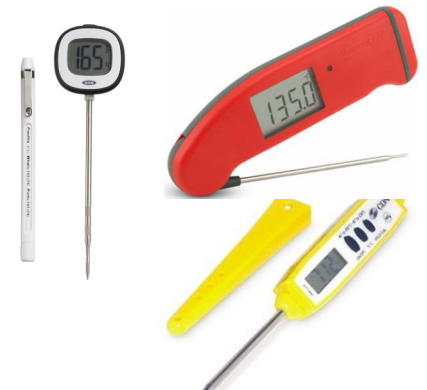
有許多類型的小型尖端探針溫度計