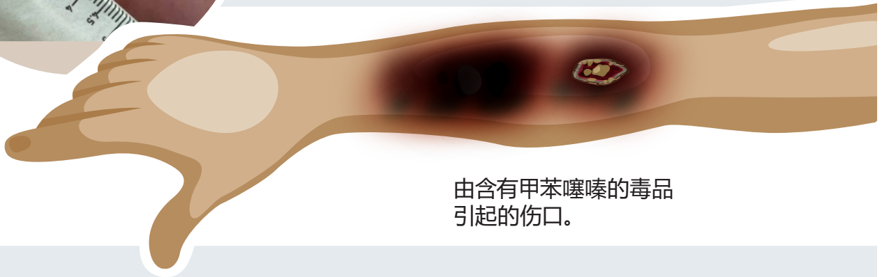
由含有甲苯噻嗪的毒品引起的伤口。