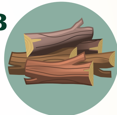
Leña – piezas más grandes de madera seca hasta de 10" de diámetro.