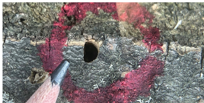
Orificio de emergencia en forma de D