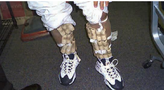
Un oficial del SITC demuestra cómo pueden entrar las aves exóticas al país ilegalmente, atados a las piernas de los contrabandistas.