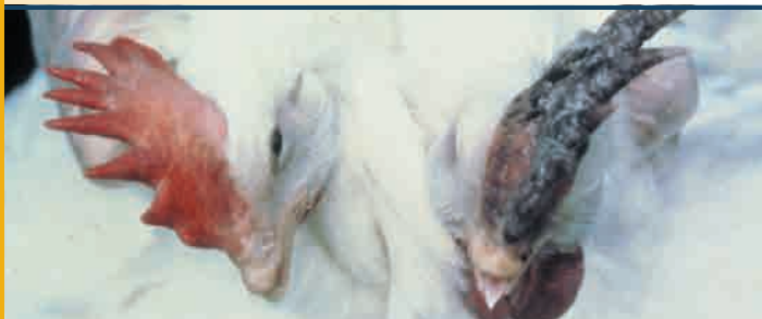
Manchas moradas en la cresta de un ave pueden indicar la presencia del virus HPAI.