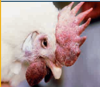
Las aves con el virus HPAI pueden mostrar indicaciones de la enfermedad con hinchazón de la cabeza, los párpados, la cresta y la carúncula.