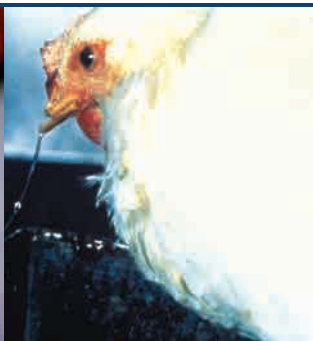
El goteo nasal puede indicar la presencia del virus HPAI.