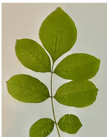
Hoja de fresno de Oregon