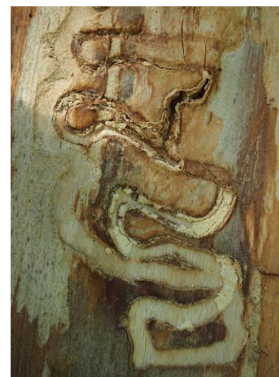
Galerías en forma de S