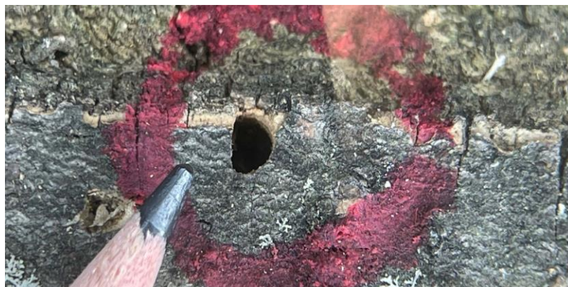
Orificio de emergencia en forma de D