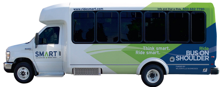
El servicio SMART 2X viajará en el corredor piloto del Autobús en el arcén.

Con ajustes pequeños pero claros al rayado del camino y otras señales, Autobús en el arcén apoya viajes más eficientes en las carreteras de Oregon sin grandes mejoras a la infraestructura que pueden tomar años en llevarse a cabo. Este proyecto piloto de Autobús en el arcén maximiza el uso de la infraestructura existente y el mantenimiento planeado para la autopista, reduciendo los recursos necesarios para su implementación.