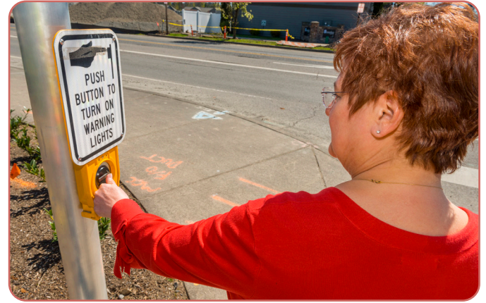
A rectangular rapid flashing beacon like the one seen above is coming to N Adair Street/OR 8/TV Highway at N 12th Avenue in Cornelius.