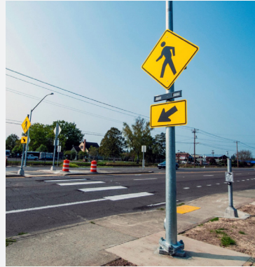
Ejemplo de un cruce de peatones con faros rectangulares de parpadeo rápido (RRFB) completado, creando un cruce peatonal más seguro y visible a lo largo de un corredor muy concurrido.

El proyecto de seguridad peatonal TV Highway (OR 8) en Aloha y Beaverton está diseñado para reducir las colisiones y mejorar la seguridad de las personas que caminan y andan en bicicleta entre SW 153rd Drive y SW 182nd Avenue. Este tramo de TV Highway es una autopista de 35-45 MPH con arcenes estrechos y largas distancias entre cruces seguros. Este es un proyecto en asociación con el condado de Washington. La construcción inicia en 2025.