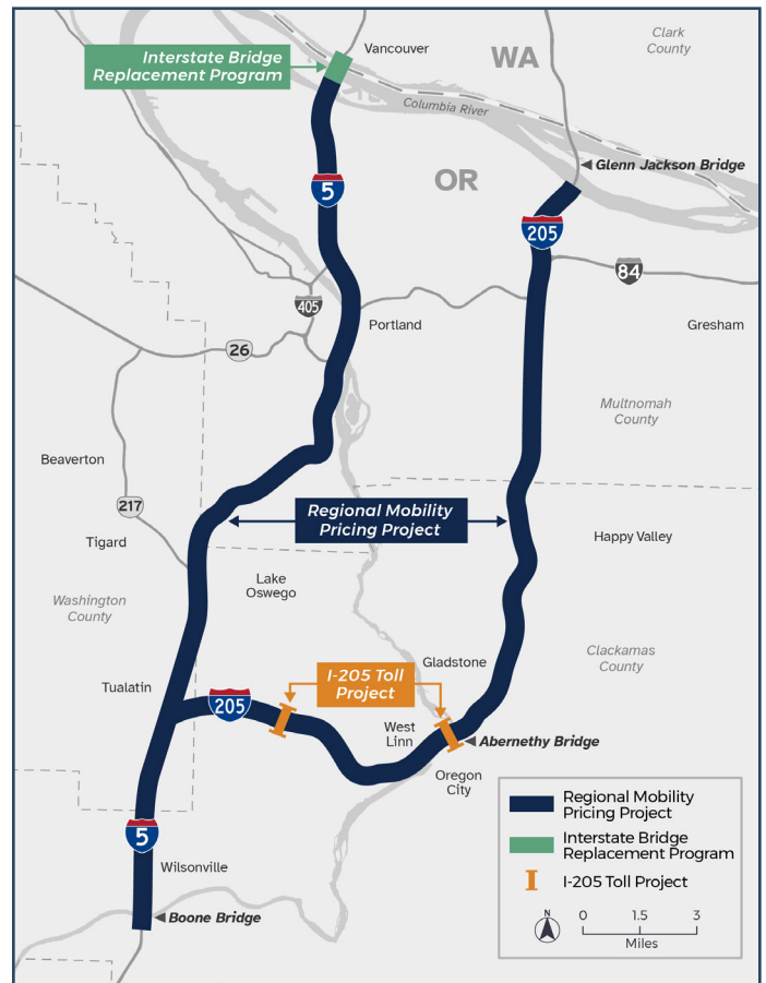
Khu vực dự án cho Dự án định giá di động khu vực và Dự án thu phí I-205.

chung xe, hay đi bằng phương thức khác, vào một thời điểm khác (hoặc kết hợp các phương án trên)