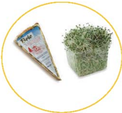
Alimentos peligrosos durante el embarazo