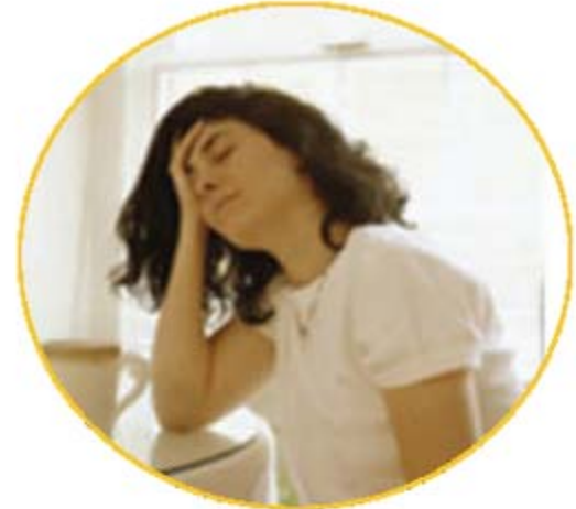
Nausea, estreñimiento y agruras