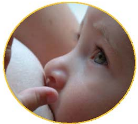
Dando pecho a mi bebé