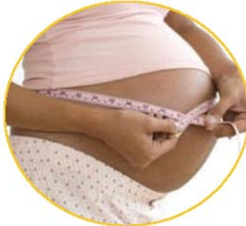
El aumento de peso