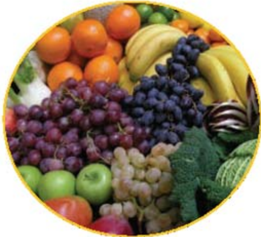
Comiendo durante el embarazo