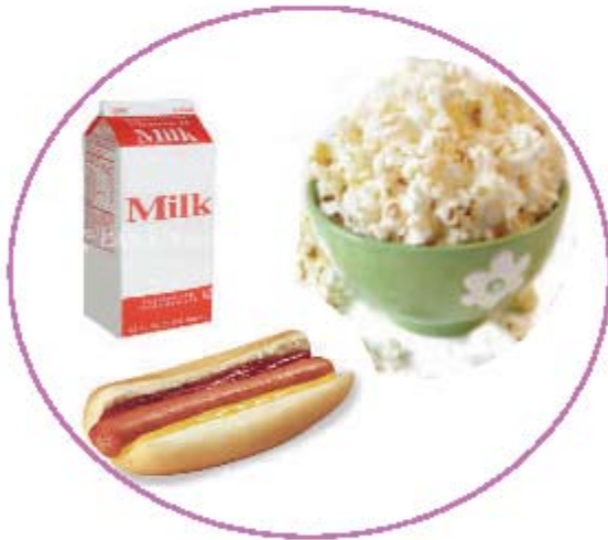
Comidas y bebidas que debe evitar