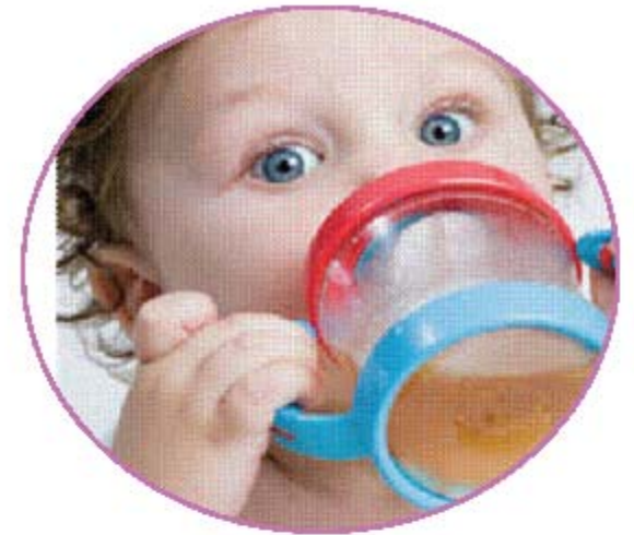
Introduciendo la taza