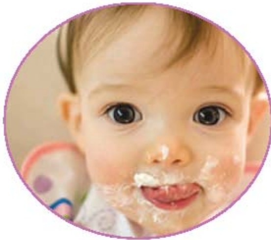
Consejos para la alimentación