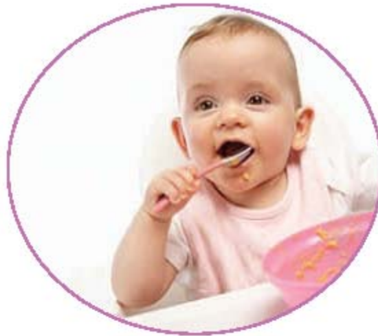
Introduciendo comidas de la familia