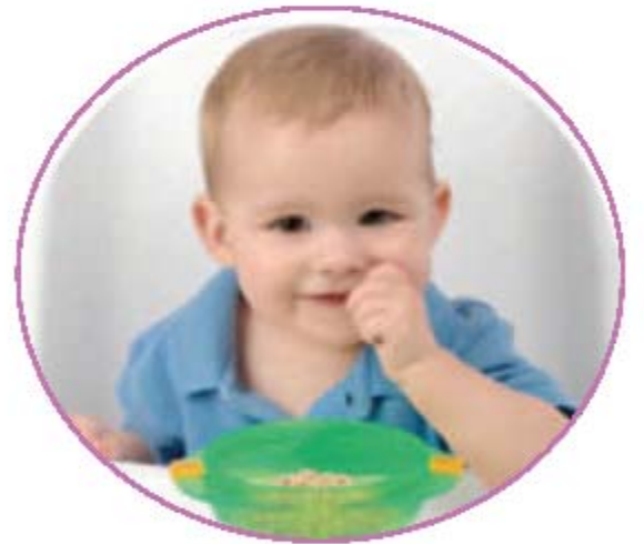
La hora de comer feliz