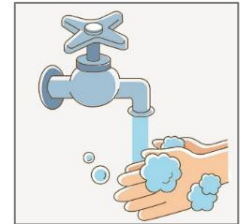
비누와 물로 손을 깨끗이 씻습니다