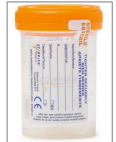
검체 용기 예시