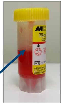
액체와 채움선이 있는 검체 용기