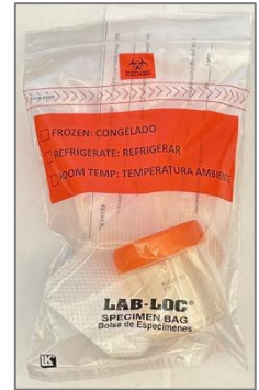
생물학적 위험물 봉투에 넣은 검체