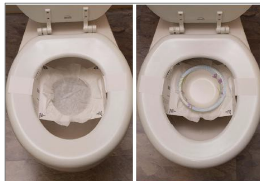
Сам вкладыш для унитаза.