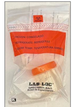
Muestra en bolsa de riesgo biológico