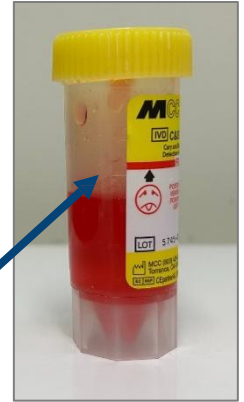
Recipiente para muestra con líquido y marca de llenado