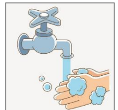
Lávese bien las manos con agua y jabón