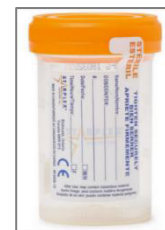
Ejemplo de un recipiente para muestra