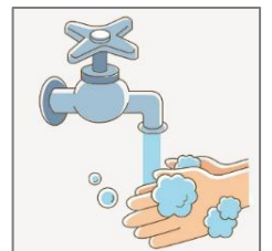
用梘液和水徹底洗手