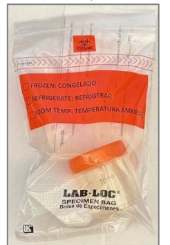
生物危害袋中的樣本