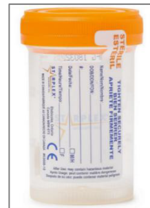
Ví dụ về hộp đưa mẫu