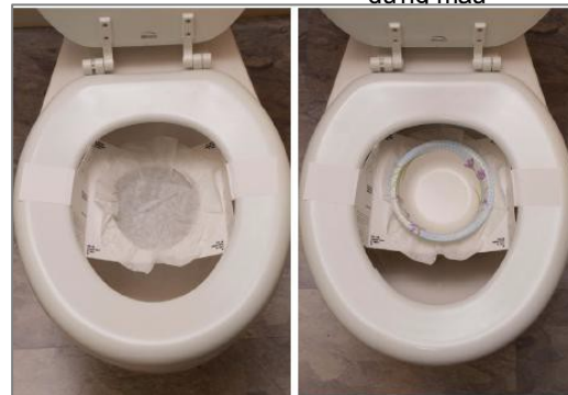
Tấm lót toilet riêng