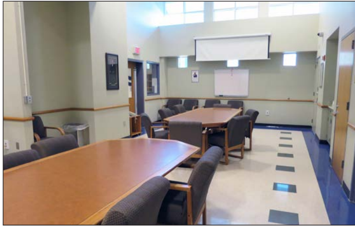
Área de visitas