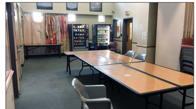
Las visitas se llevan a cabo en la sala de conferencias grande de Oak Creek.