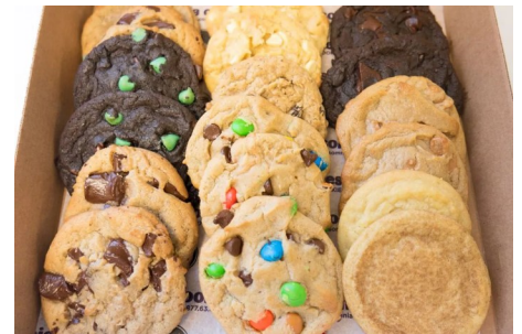
Sản phẩm nướng (như bánh quy, bánh rán và bánh nướng hoa quả), kẹo táo và kombucha hiện phải đáp ứng các yêu cầu này