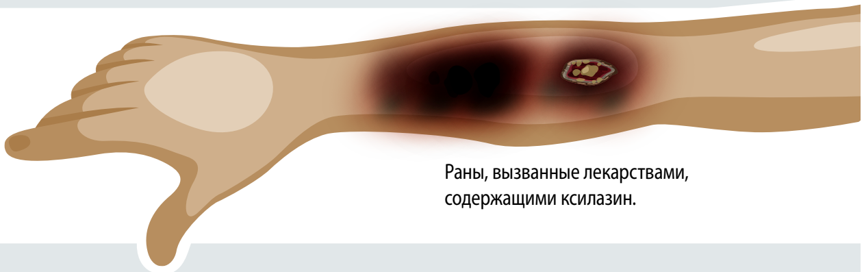
Раны, вызванные лекарствами, содержащими ксилазин.

Препараты, содержащие ксилазин, могут вызывать раны, которые развиваются скоротечно и трудно поддаются лечению.